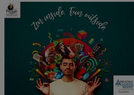
2/3 BHK apts available at Prestige North Point Prestige Group