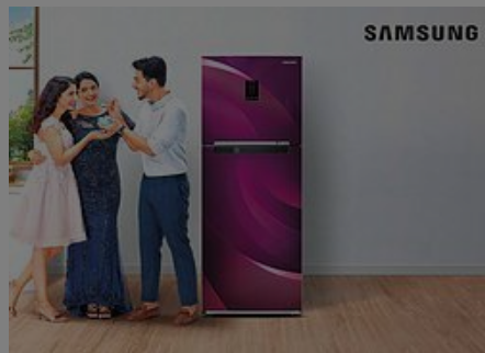
Samsung Curd Maestro™ Refrigerator - Now make perfect curd. Samsung