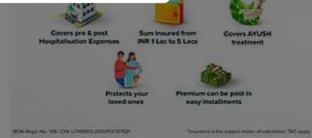
IFFCO-TOKIO is a leading private general insurance... IFFCO-TOKIO