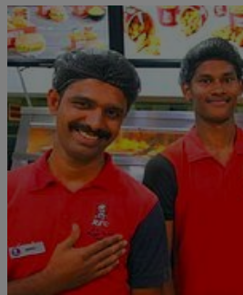
You never saw resignation letter as this KFC employee... ArborBlog.Com