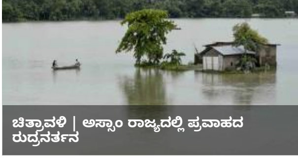
ಚಿತ್ರಾವಳಿ | ಅಸ್ಸಾಂ ರಾಜ್ಯದಲ್ಲಿ ಪ್ರವಾಹದ ರುದ್ರನರ್ತನ