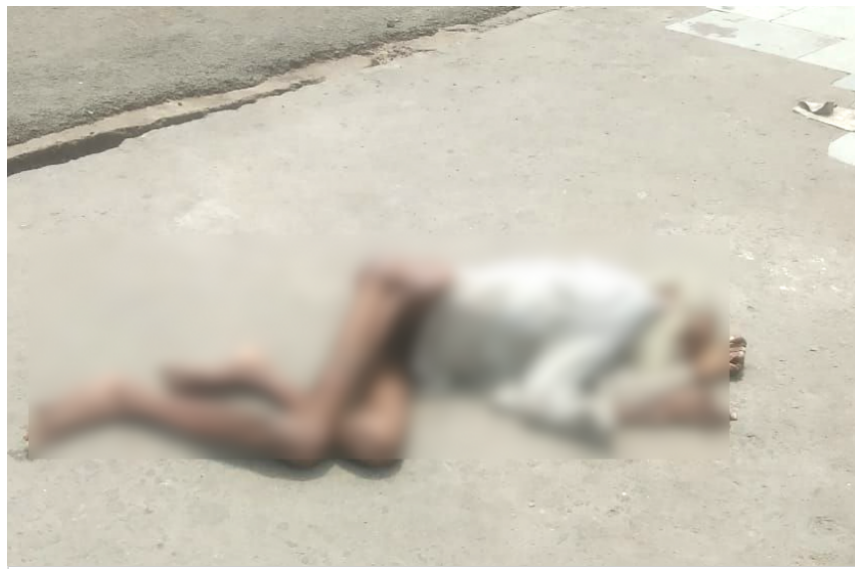
Fact Check : लॉकडाउन में भूख के कारण हुई थी 70 साल के बुजुर्ग की मौत? सड़क पर पड़ा था शव

भोपाल/ मध्य प्रदेश में कोरोना वायरस बहुत तेजी से अपने पांव पसार रहा है। मौजूदा आंकड़ों के मुताबिक, प्रदेश में अब तक 2387 कोरोना के पॉजिटिव मरीज सामने आ चुके हैं, जबकि मृतकों की संख्या 120 पार कर चुकी है। ये हालात उस समय हैं जब केन्द्र और राज्य सरकार द्वारा देश-प्रदेश में लॉकडाउन किया गया है। संक्रमितों का लगातार तेजी से बढ़ता आंकड़ा उस समय का है, जब पूरा देश अपने घरों में कैद है। फिर जरा सोचिये कि, अगर लॉकडाउन न किया गया होता तो हालात क्या होते? यानी कुल मिलाकर संक्रमण का फोरी बचाव लॉकडाउन करके सोशल डिस्टेंसिंग को मेंटेन रखना है, ताकि इसका प्रभाव बड़ी आबादी तक पहुंचने से रोका जाए। लॉकडाउन लोगों को संक्रमण से बचाने का तो बेहतर तरीका है, लेकिन इसका विपरीत असर कई गरीब-मजदूरो पर पड़ रहा है।